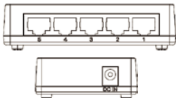
5 Portas 10/100/1000Mbps Switch como exemplo

A figura abaixo mostra o painel traseiro e a interface DC da Switch. As portas MDI/MDI-X localizam-se no painel traseiro e o adaptador de energia externo DC do lado esquerdo.